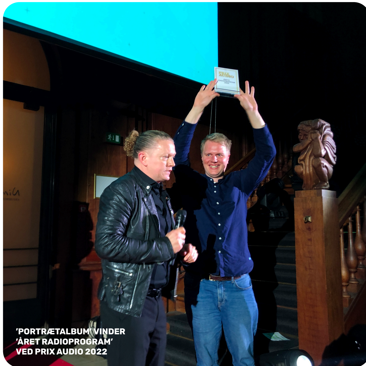
'PORTRÆTALBUM' VINDER 'ÅRET RADIOPROGRAM' VED PRIX AUDIO 2022