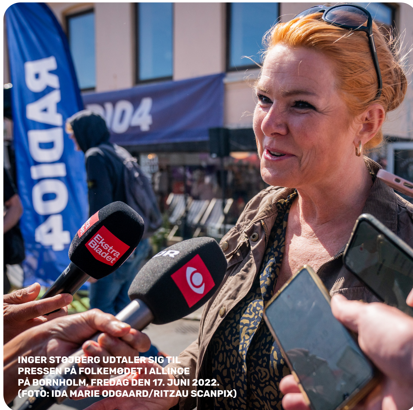
INGER STØJBERG UDTALER SIG TIL PRESSEN PÅ FOLKEMØDET I ALLINGE PÅ BORNHOLM, FREDAG DEN 17. JUNI 2022.