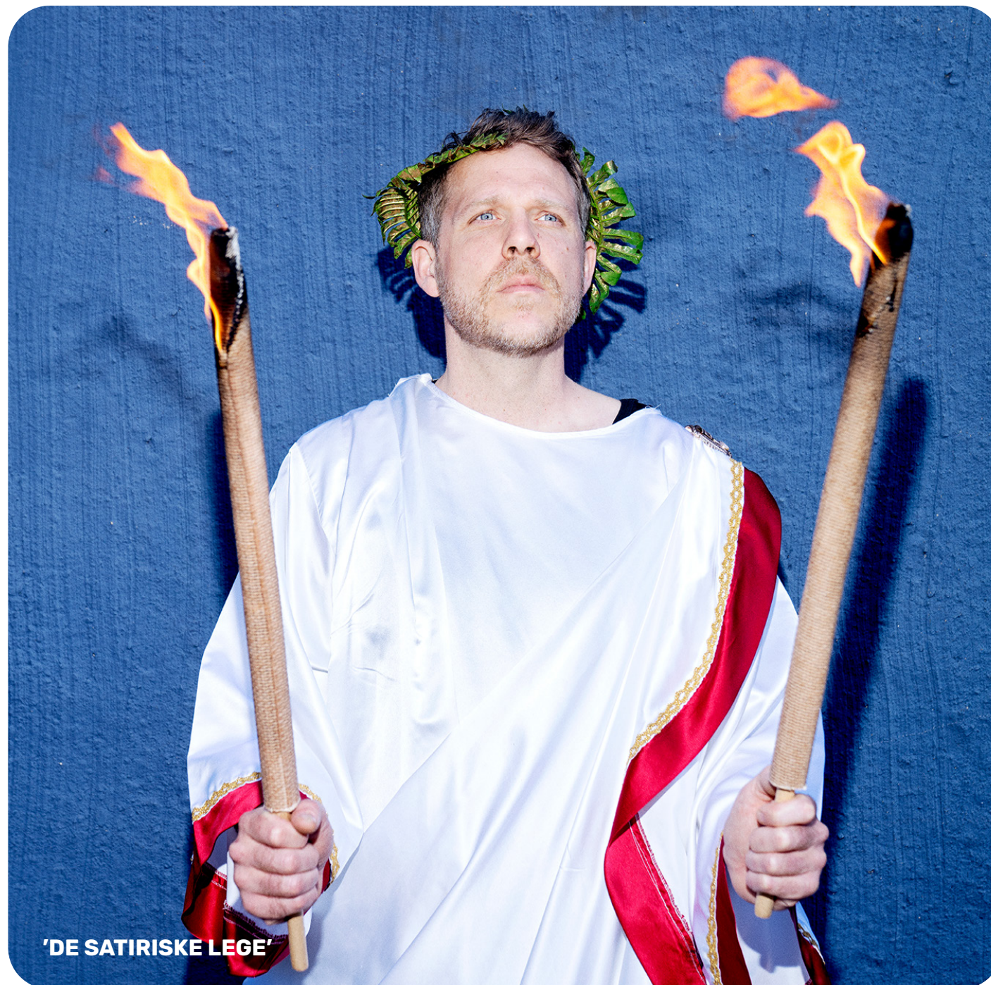
'DE SATIRISKE LEGE'