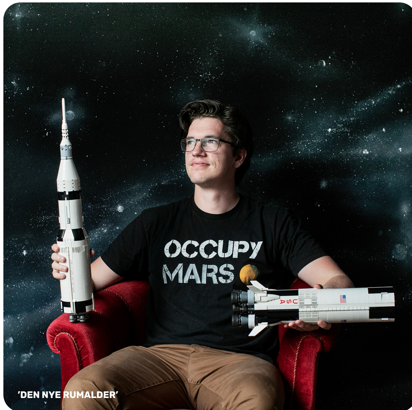
'DEN NYE RUMALDER'